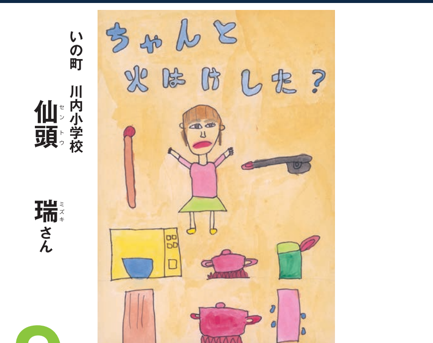
9月 (長月 ながつき) September いの町 川内小学校 仙頭 瑞さん